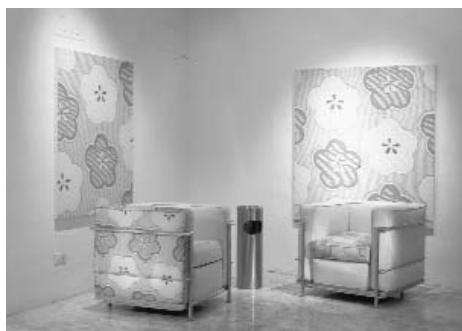
UNTITLED CIGARETTE BREAK, 1999, Taipei (M.L.)

répète, les peint et les arrange en vastes interventions architecturales, qu'il s'agisse d'un revêtement, de l'habillage d'un mur entier comme récemment pour le pavillon de Taiwan à la Biennale de Venise (2001) ou d'un sol comme à la Villa Merkel ou à la Hagia Eirene pour la Biennale d'Istanbul (2001). La beauté des fleurs, des feuilles et des rameaux rappelle dans sa représentation stylisée des structures ornementales, comparables à la Pièce