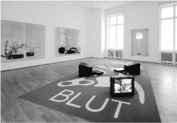
HANDMADE, 2000, Werk Raum 1 , Hamburger Bahnhof, Berlin (R. M.)

photographiées sous éclairage en transparence, tirées de l'ouvrage Leuchten '73 . 16