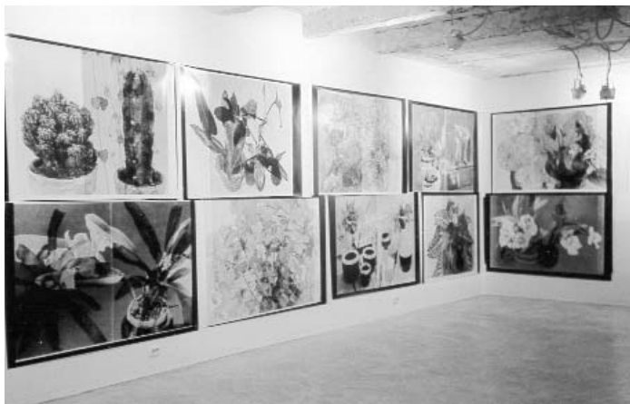
FOR THE BIRDS, 2000, AIDAN Gallery, Moscow (R.M.)

Ces pages détachées sont éclairées en transparence par le photographe afin de rendre visibles – rappelant l'effet d'une double exposition photographique – les deux images imprimées ou l'hybride de leur superposition. La série se subdivise en nombreux sous-groupes, tels que L pour Paysages (allemand : Landschaft ), M pour Gens (allemand : Menschen ), P pour Plantes et T pour Animaux (allemand : Tiere ), au sein desquels les œuvres sont numérotées, Pièce florale , en allusion à la terminologie de l'histoire de l'art, On the Journey , des portraits de voyage de diverses régions, ainsi que Bonsai , Ikebana et Luminaires , dont les noms désignent les motifs. Le procédé d'imagerie artistique reste le même. Ce qui varie, c'est le point de vue d'observation artistique par rapport à l'objet de l'image, de sorte que le spectateur a affaire à des œuvres très diverses s'inscrivant dans des contextes différenciés.