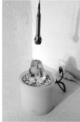
AQUA PER POSCHIAVO, 2000 (R.M.)

On peut voir une certaine parenté avec BonsaiPotato dans Aqua per Poschiavo (2000), un objet trouvé ou ready-made, variante d'un kit de fontaine d'intérieur tel qu'on les trouve couramment dans les grandes surfaces, qui avait fait partie de l'exposition Fatto a Mano à la Galleria Periferia de Poschiavo en Suisse. L'objet oscille entre l'histoire de l'endroit – qui subit une grave inondation en 1987 – auquel le titre fait allusion, son aspect