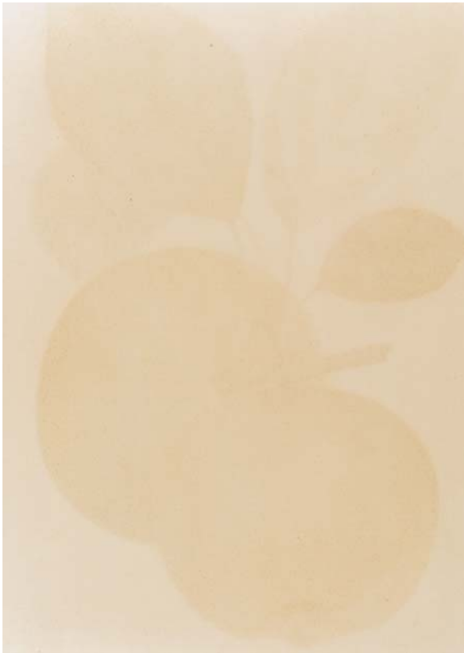
Am schönsten zu zweit, 1, 1994 RC-Print, Aluminium, Holz, 185x125 cm