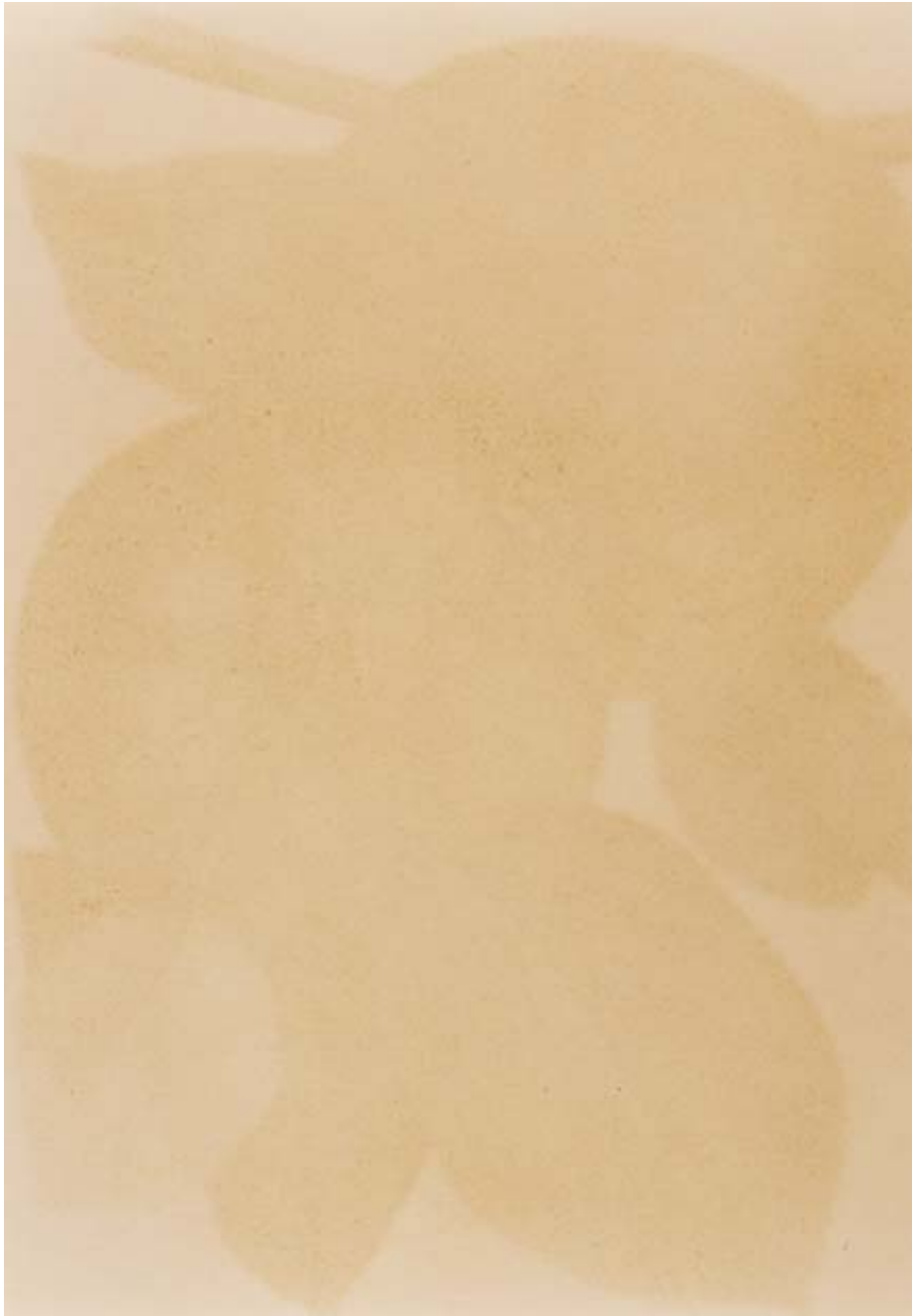
Am schönsten zu zweit, 3, 1994 RC-Print, Aluminium, Holz, 185x125 cm