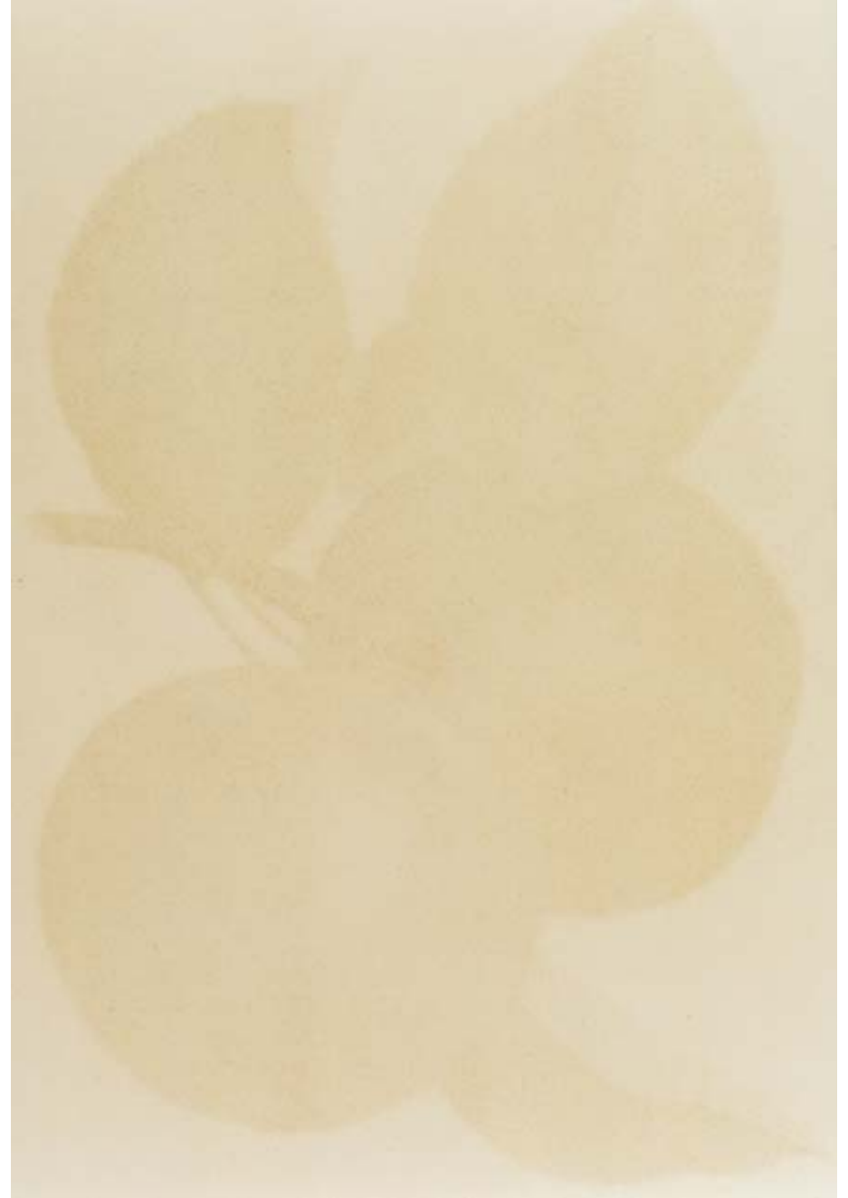
Am schönsten zu zweit, 2, 1994 RC-Print, Aluminium, Holz, 185x125 cm