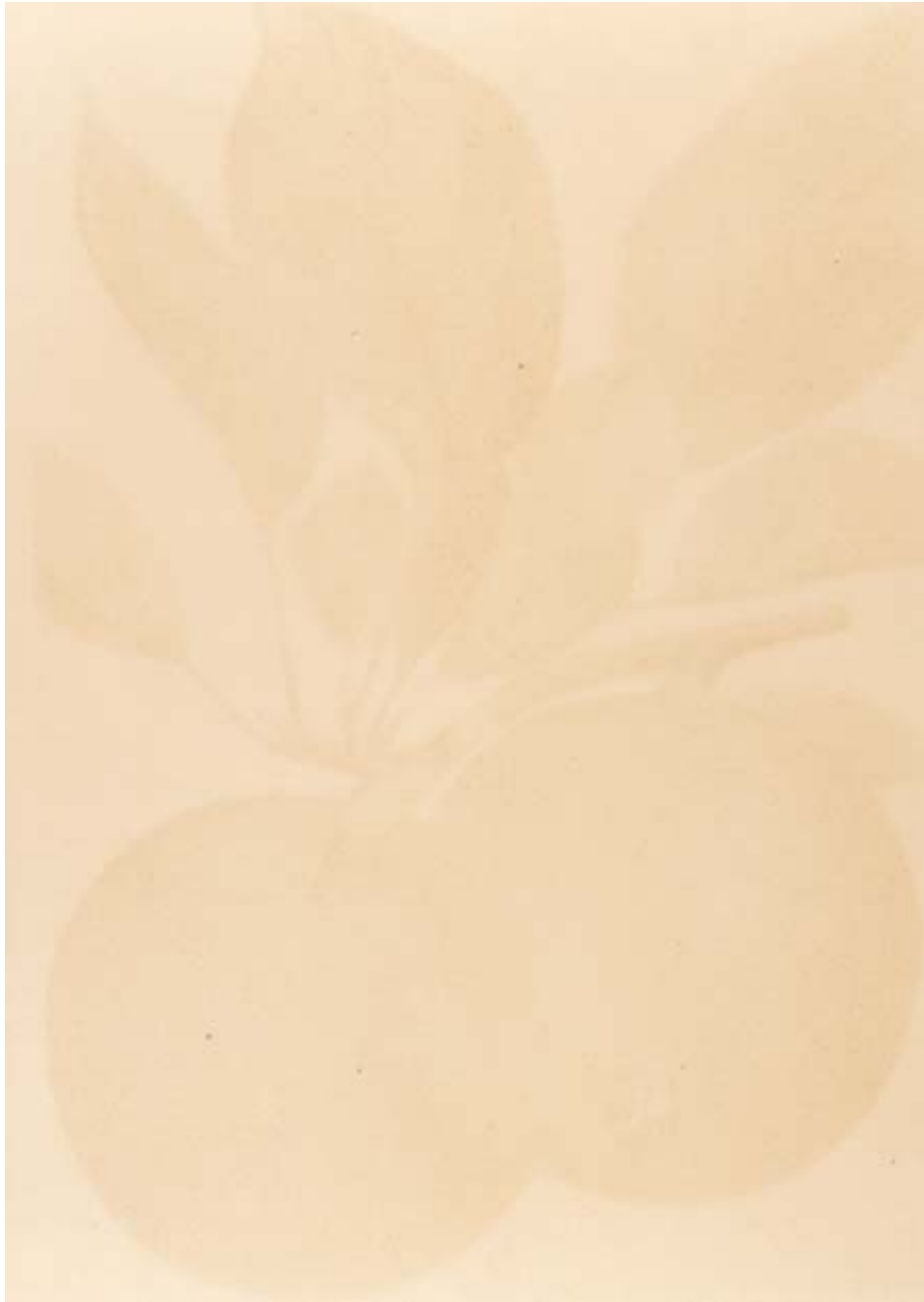
Am schönsten zu zweit, 5, 1994 RC-Print, Aluminium, Holz, 185x125 cm