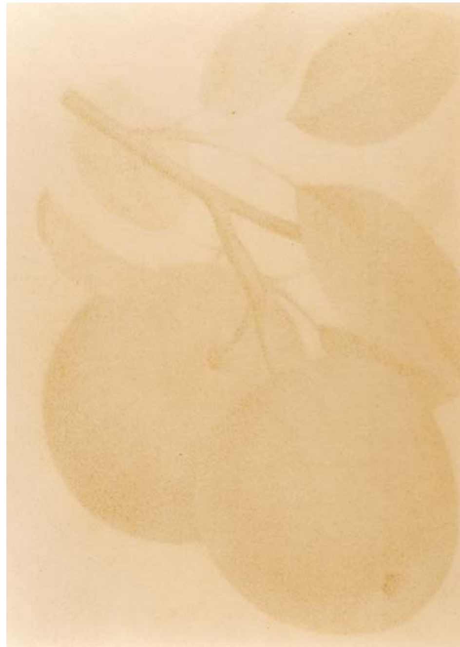
Am schönsten zu zweit, 2, 1994 RC-Print, Aluminium, Holz, 185x125 cm