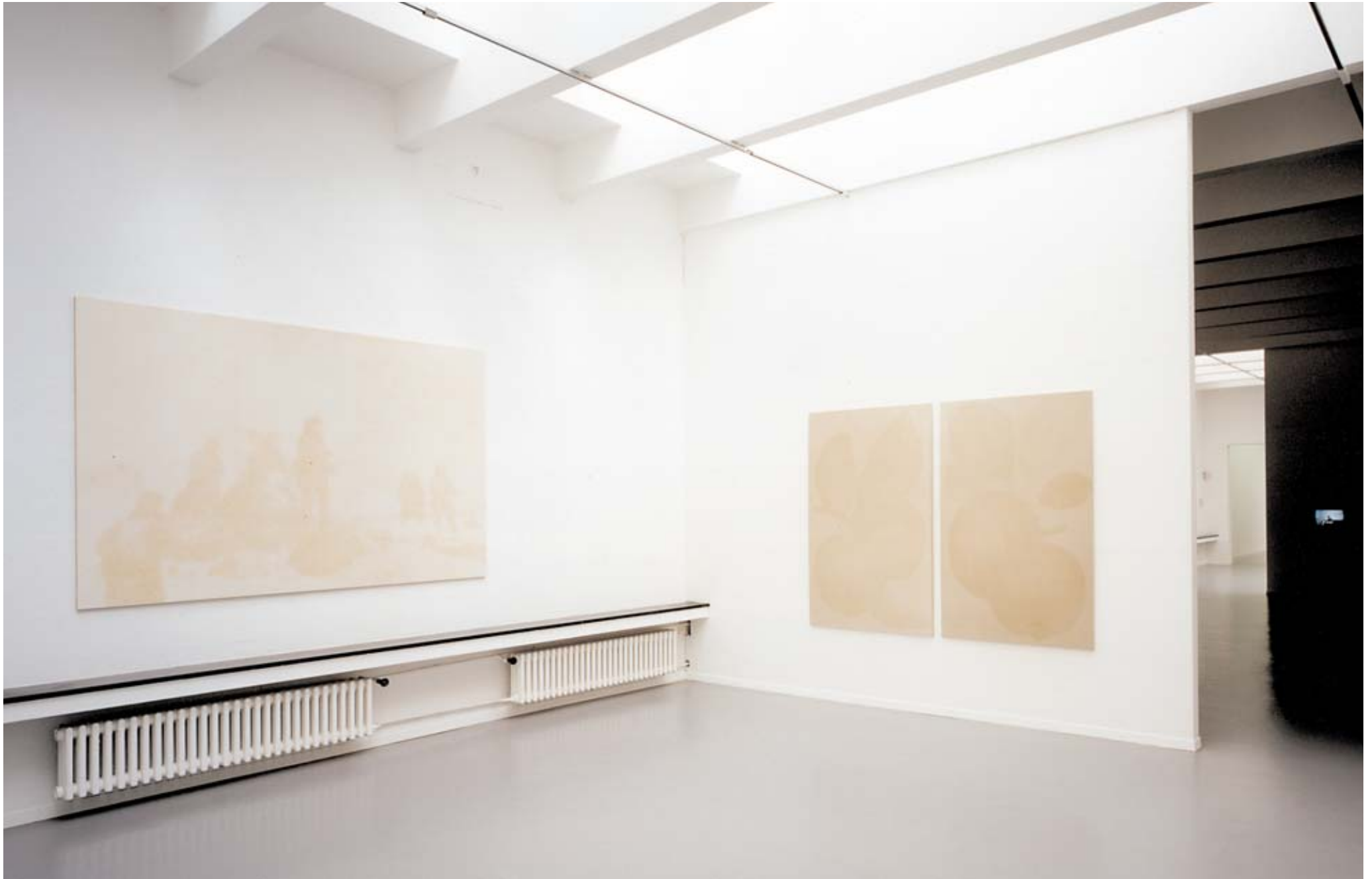
Reisegruppe, 1995 (l), Am schönsten zu zweit, 2 und 4, 1994, (r) Kunstmuseum Luzern, 1996