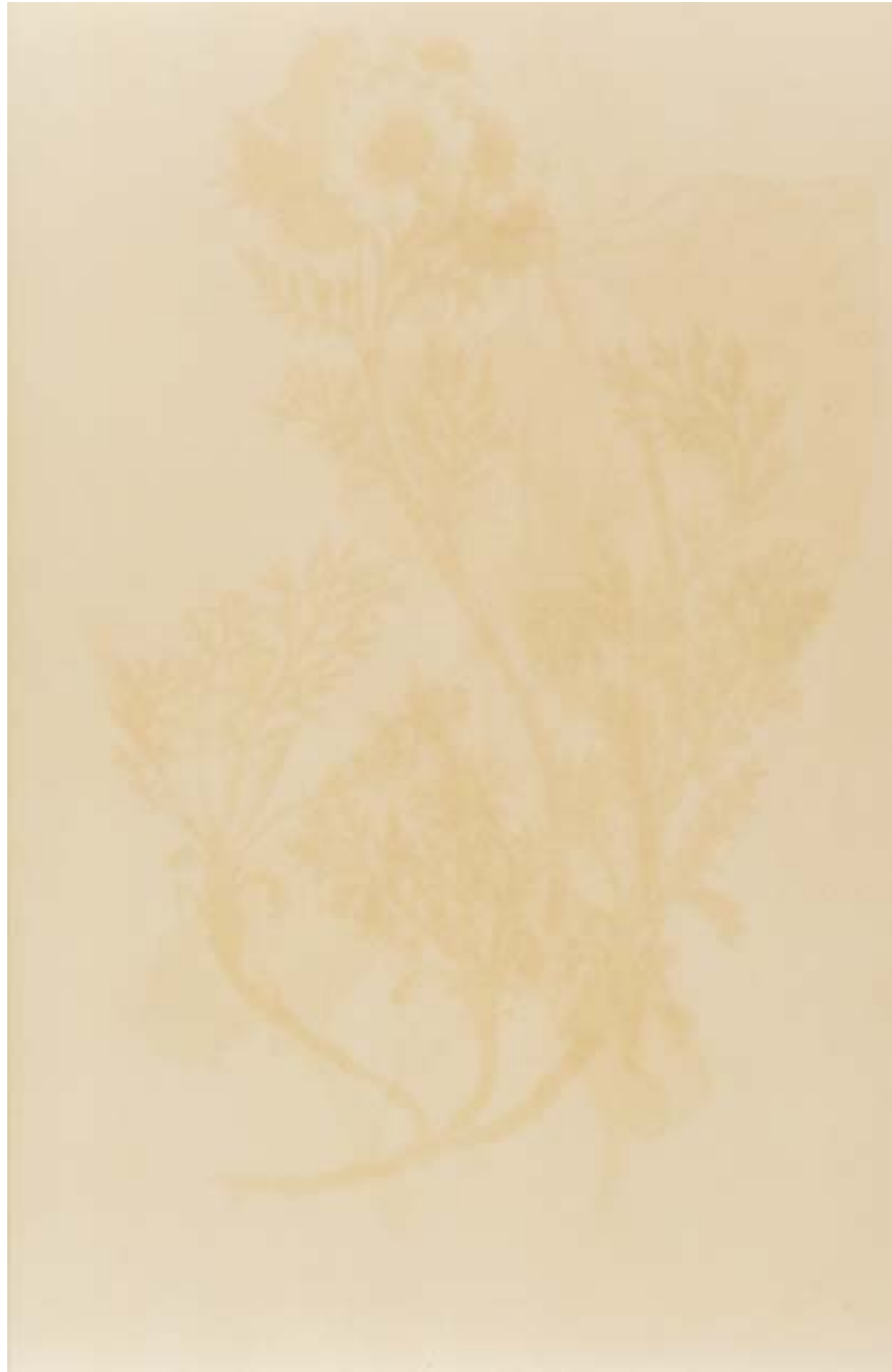
Emigranten 2, 1994 RC-Print, Aluminium, Holz, 155x130 cm