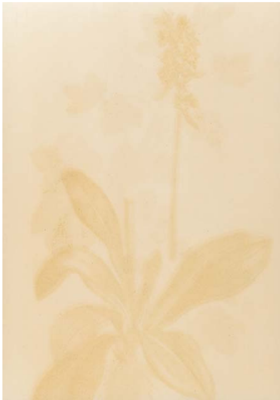
Emigranten, 3, 1994 RC-Print, Aluminium, Holz, 155x130 cm