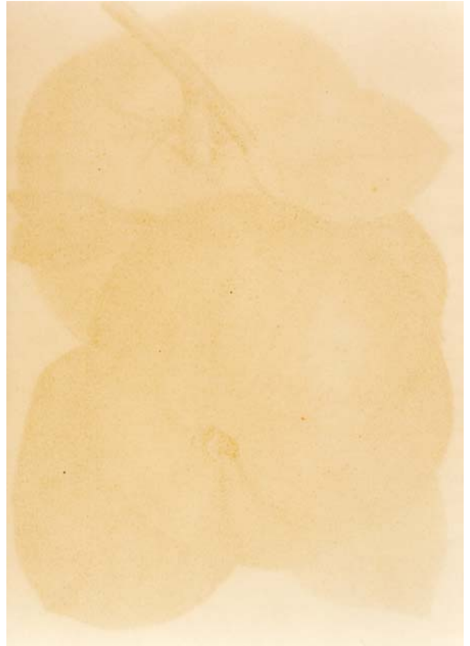
Am schönsten zu zweit, 6, 1994 RC-Print, Aluminium, Holz, 185x125 cm