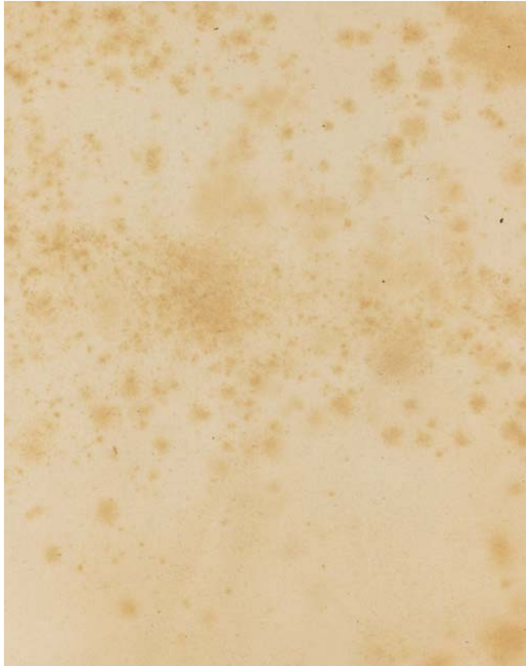
Voltaire, 1994 RC-Print, Aluminium, Holz, 250x180 cm