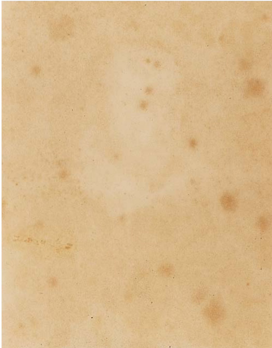
Shakespeare, 1994 RC-Print, Aluminium, Holz, 250x180 cm